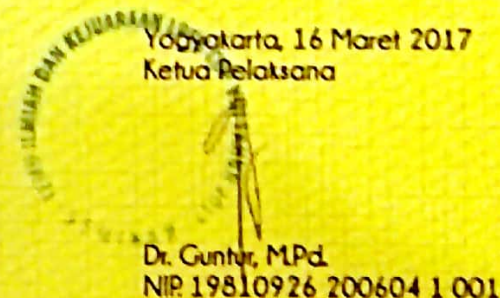
Yogyakarta, 16 Maret 2017 Ketua Pelaksana